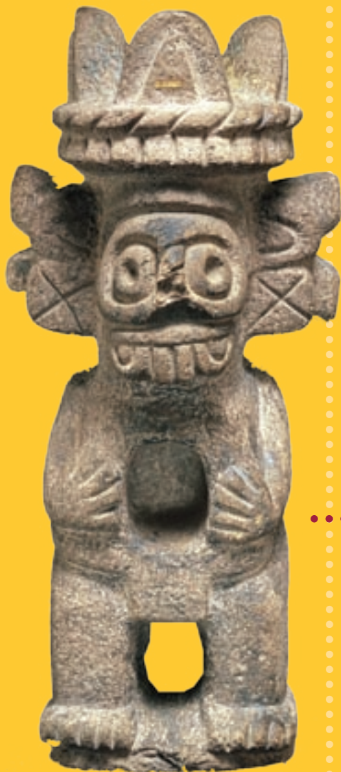
Tlaloc Južná Amerika, Mexiko koniec 19., začiatok 20. stor. vulkanická hornina 43,7 x 19,7 x 16,4 cm