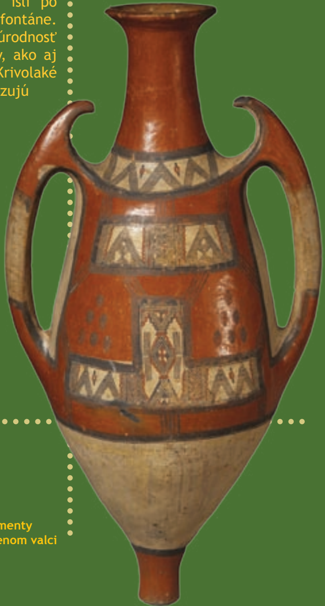
Krčah Afrika, Alžírsko 19. storočie pálená hlina, prírodné pigmenty zhotovený ženami na hlinenom valci 77,5 x 37,8 x 28,7 cm

T ento krčah je veľmi starý. Ženy ho nosievali na chrbte, keď išli po vodu ku prameňu alebo fontáne. Jemné vzory značia úrodnosť zeme a plodnosť ženy, ako aj ochranné symboly. Krivolaké čiary a ozdoby symbolizujú vodu, ktorá zúrodňuje pôdu. Čierne body umiestnené do tvaru trojuholníka znázorňujú polia.